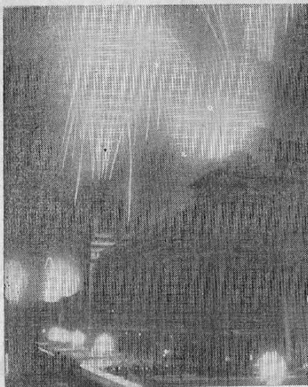
Impresionante fotografía de el saludo a la victoria hecho por medio de cohetes luminosos sobre el Hotel Moeckva en la capital soviética.

LAS CELEBRACIONES DE LA VICTORIA EN MOSCÚ